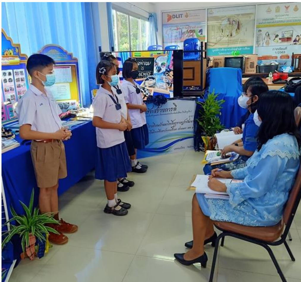
คณะกรรมการตัดสินฟังการนำเสนอผู้เข้าร่วมประกวดแข่งขัน กิจกรรมบรืสร้างการดี ผลงาน/นวัตกรรมที่เป็นเลิศ (Best Practice) ครูผู้สอนและผู้บริหารสถานศึกษา