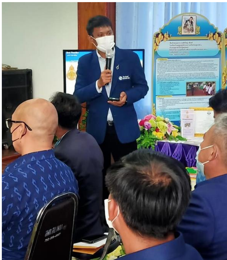
พิธีเปิดและจัดนิทรรศการพร้อมการประกวดแข่งขันกิจกรรมตามโครงการโรงเรียนสุจริต

วันที่ 5 สิงหาคม 2565 ณ สำนักงานเขตพื้นที่การศึกษาประถมศึกษาสกลนคร เขต 1