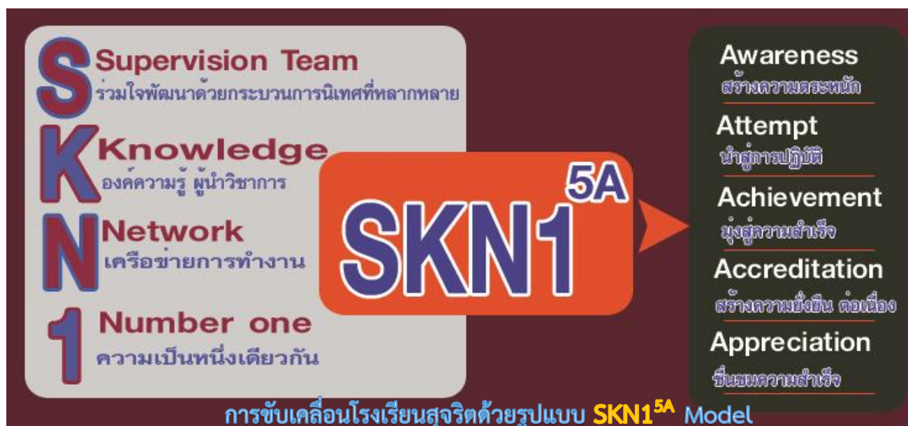
ภาพประกอบ 1

สำนักงานงานเขตพื้นที่การศึกษาประถมศึกษาสกลนคร เขต 1 ได้รูปแบบการขับเคลื่อนโรงเรียนสุจริตตามโครงการเสริมสร้างคุณธรรม จริยธรรมและธรรมาภิบาลในสถานศึกษา (โครงการโรงเรียนสุจริต) ดังภาพ