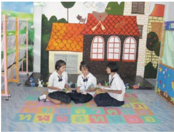
โรงเรียนบ้านดอนขุนห้วย

ทั้งนี้ได้กำหนดเป้าหมายเป็น ๒ ระยะ คือ เป้าหมาย ปีงบประมาณ ๒๕๖๑ และเป้าหมายปีงบประมาณ ๒๕๕๗-๒๕๕๘ มีรายละเอียด ต่อไปนี้