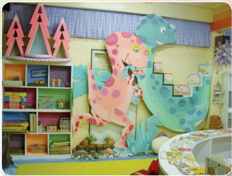
โรงเรียนวัดประดอราษฎร์บำรุง