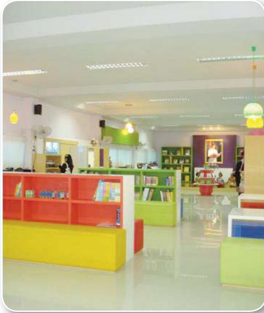
โรงเรียนวัดมหาบุศย์ สำนักงานเขตพื้นที่การศึกษาประถมศึกษากรุงเทพมหานคร