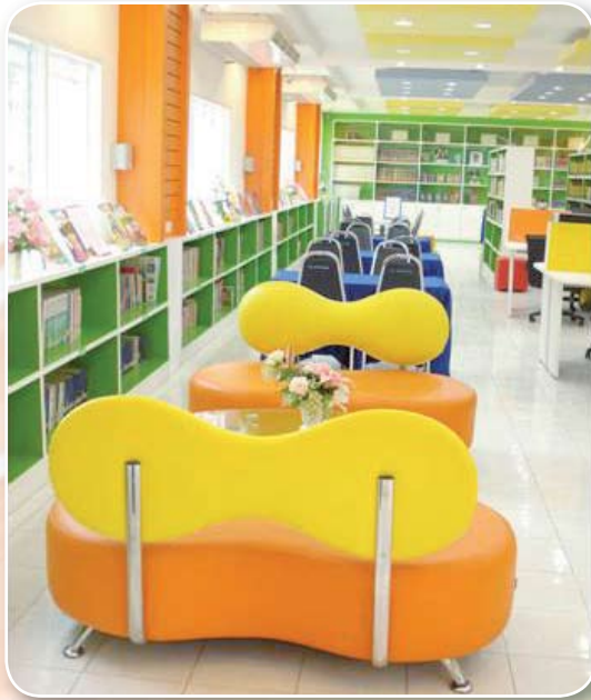
โรงเรียนวัดตะคร้ำเอน สำนักงานเขตพื้นที่การศึกษาระถมศึกษากาญจนบุรี เขต ๒