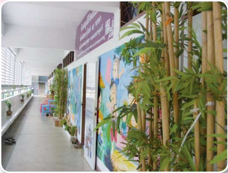
โรงเรียนวัดประดอราษฎร์บารุง