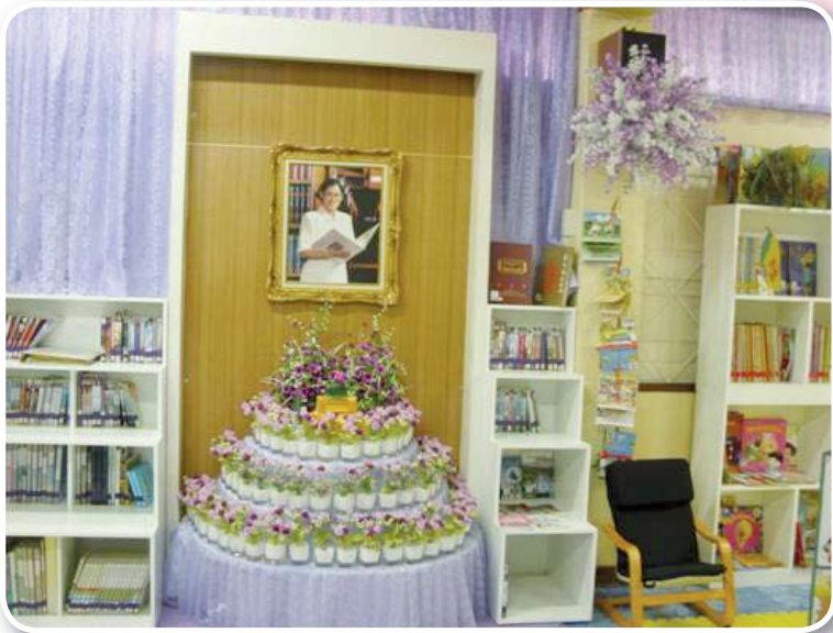
โรงเรียนวัดประกอบราษฎร์บำรุง สำนักงานเขตพื้นที่การศึกษาประถมศึกษาฉะเชิงเทรา เขต ๑