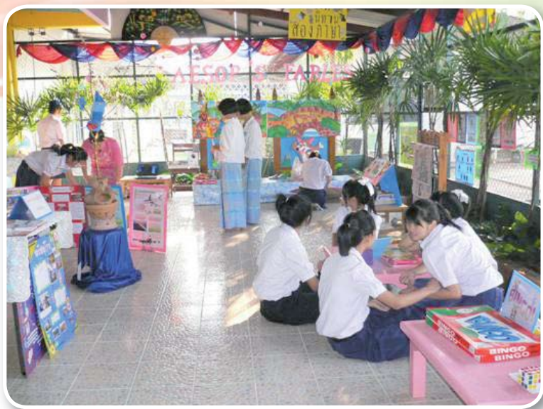
โรงเรียนแม่ฟ้าหลวง