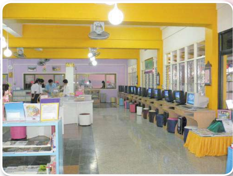
โรงเรียนแม่ทาวทิยาคม สำนักงานเขตพื้นที่การศึกษามัธยมศึกษา เขต ๓๕