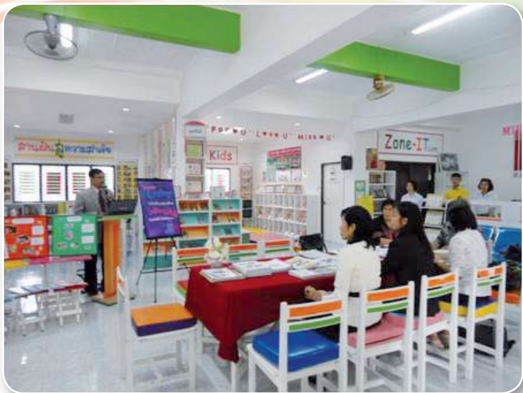
โรงเรียนนารีนุกูล ๒ สำนักงานเขตพื้นที่การศึกษามัธยมศึกษา เขต ๒๔