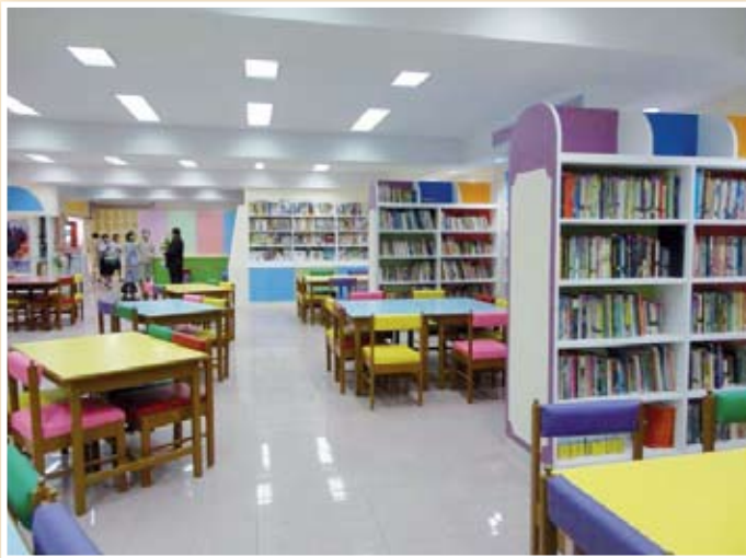
โรงเรียนมัธยมวัดดาวคะนอง