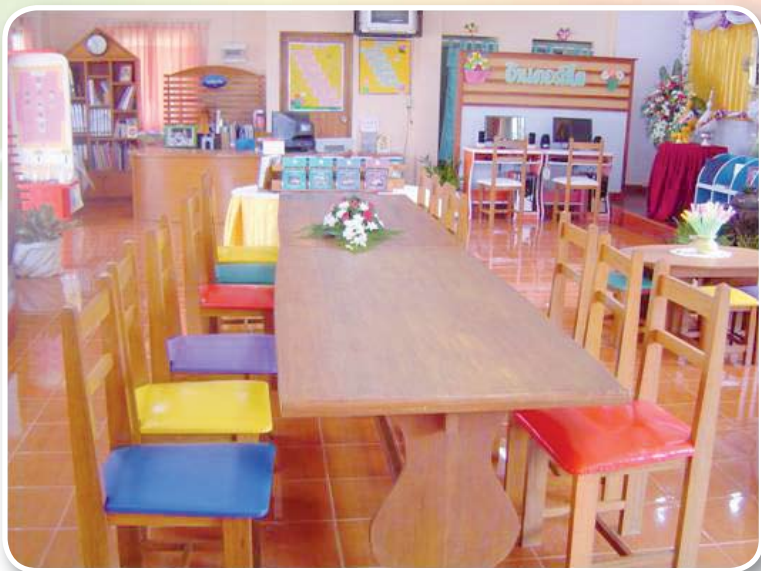
โรงเรียนบ้านในไร่ สำนักงานเขตพื้นที่การศึกษาประถมศึกษาพังงา