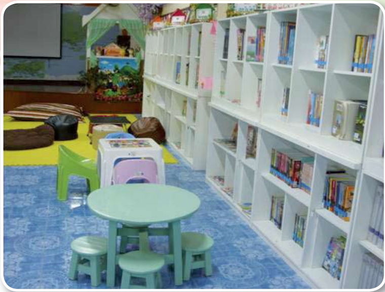
โรงเรียนวัดประดอราษฎร์บำรุง