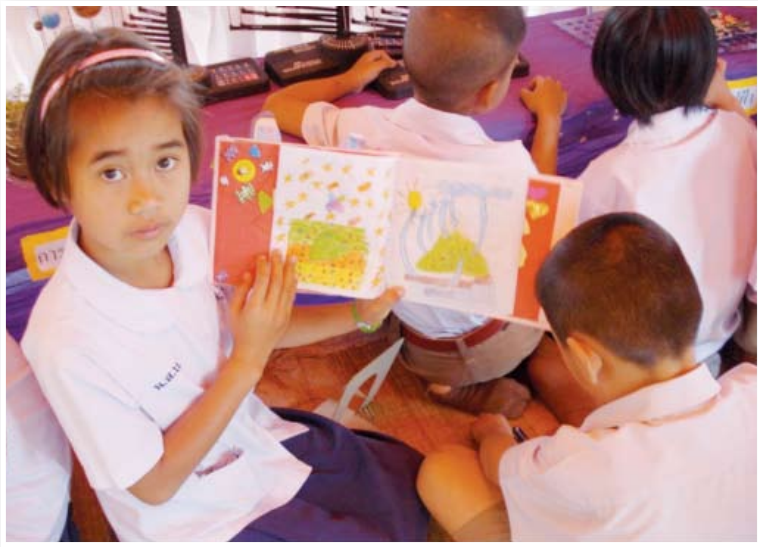
โรงเรียนบ้านวังหินชา

ตลอดชีวิต มีความสามารถในการประเมิน เลือกรับ และใช้ประโยชน์จากสารสนเทศ ได้อย่างมีประสิทธิภาพและมีจริยธรรม มีจิตสำนึกและเห็นคุณค่าของการใช้ห้องสมุด และทรัพยากรสารสนเทศ และมีทักษะในการใช้เทคโนโลยีอย่างรับผิดชอบและมีประสิทธิภาพ ซึ่งหากพัฒนาให้เป็นที่ไปตามเป้าหมายเหล่านี้แล้วจะส่งผลต่อผลสัมฤทธิ์ทางการเรียนของนักเรียน และเป็นเครื่องมือสำหรับนักเรียน ในการแสวงหาความรู้สำหรับการพัฒนาตนเองอย่างต่อเนื่องตลอดชีวิต และดำรงชีวิตในสังคมที่มีความเปลี่ยนแปลงอย่างรวดเร็ว ตลอดจนเป็นพลเมืองที่มีความรับผิดชอบต่อสังคมและโลก