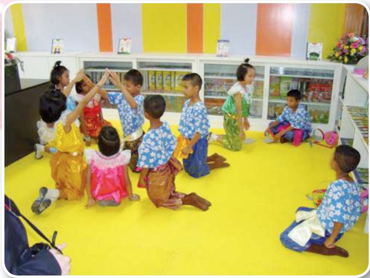
โรงเรียนวัดถนน สำนักงานเขตพื้นที่การศึกษาประถมศึกษาอ่างทอง