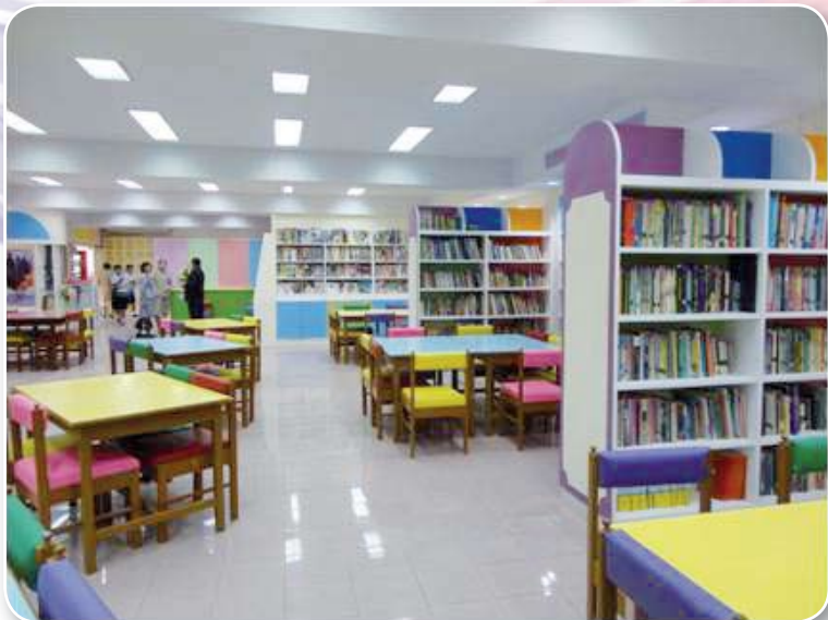
โรงเรียนมัธยมวัดดาวคะนอง สำนักงานเขตพื้นที่การศึกษามัธยมศึกษา เขต ๑